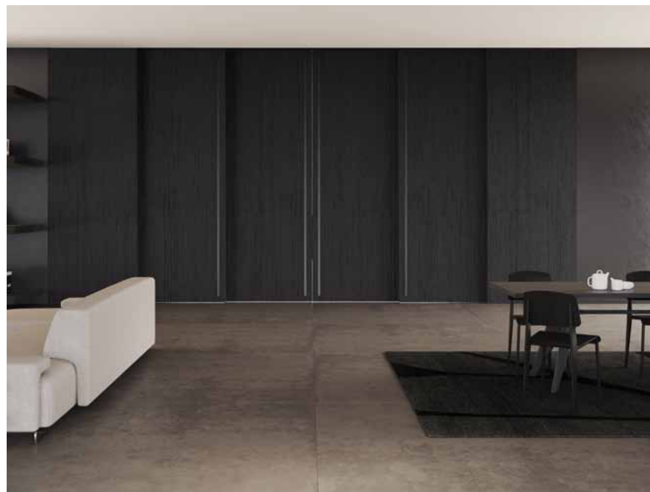
MAREA | SISTEMA SCORREVOLE IN LUCE ALTOPIANO BY GIULIO CAPPELLINI Ante multiple | Finitura rovere tinto nero | maniglia ad incavo a tutta altezza, anodizzata argento

Dietro al nostro lavoro si nasconde una storia tutta italiana fatta di design e grande esperienza. L'elevato know how mascherato dall'apparente semplicità della porta filo muro, insieme all'altissimo grado di "customizzazione" dei progetti, permette di soddisfare anche i più esigenti desideri estetici e funzionali.