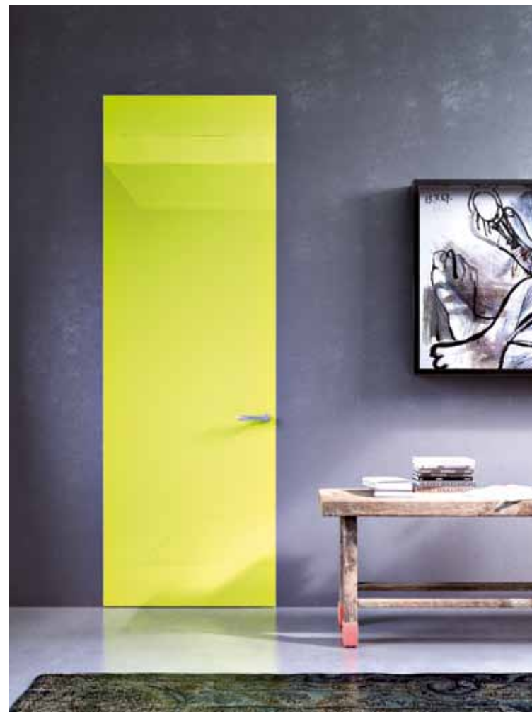
ALBA | BATTENTE INFINITO | Finitura metacrilato, effetto lucido

Offriamo una capillare e organizzata rete di squadre di posatori specializzati, presente su tutto il territorio nazionale, che operano con competenza e professionalità per garantire le migliori prestazioni estetiche, funzionali e di durabilità dei prodotti.